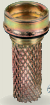
Attacco a vite Screw fit