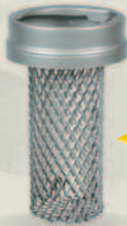
Attacco a baionetta Bayonet fit